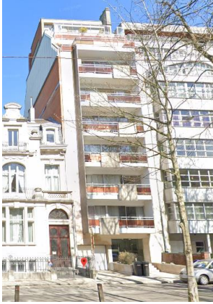
Winston Churchilllaan 190