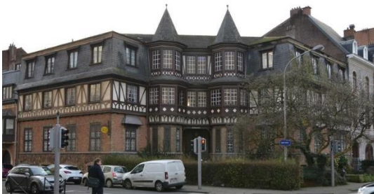
Winston Churchilllaan 135

Eind 19e tot midden 20e eeuw. Hij is geïnspireerd op de landelijke architectuur, in het bijzonder op de Engelse "cottages". Hij wordt gekenmerkt door het gebruik van elementen in hout of imitatiehout: borstweringen, vakwerk, loggia's, enz. Pittoreske vormen, in het bijzonder van de daken, verrijken de volumes.