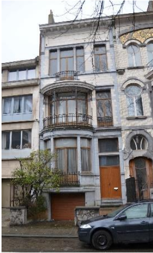
Winston Churchilllaan 31

De stijl neemt naargelang zijn overheersende inspiratie vorm aan in laat-eclecticisme, beaux-arts, eclecticische stijl met polychroom parement, neobarok en neorenaissance. De Eerste Wereldoorlog zorgt ervoor dat hij bijna volledig verdwijnt.