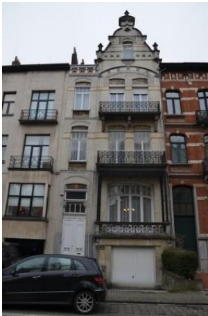
Winston Churchilllaan 78