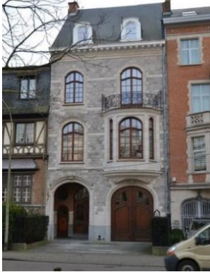
Winston Churchilllaan 133