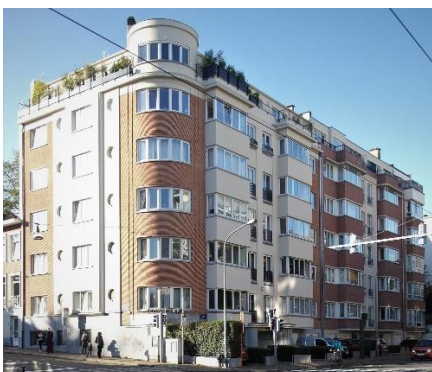
Winston Churchilllaan 175

Is een internationale stroming waarbij de functie de bovenhand heeft op de vorm. Stijl gebaseerd op de vooruitgang van de nieuwe technologieën, de eenvoud, het gebrek aan decoratie, goedkope materialen en de massaproductie. Hij wordt gekenmerkt door het gebruik van simpele geometrische volumes, platte daken, vensters met een vensterlijst en moderne materialen zoals gewapend beton.