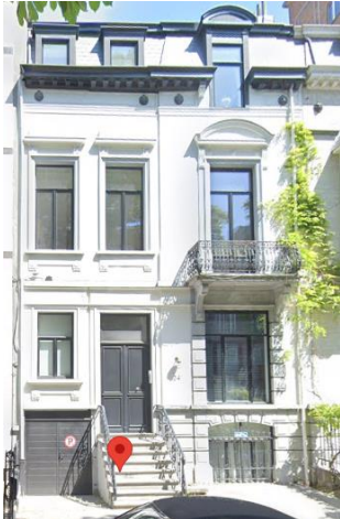
Winston Churchilllaan 24

De stijl kent een lange levensduur, die in de loop der tijd evolueert in de verhoudingen en in de versiering.