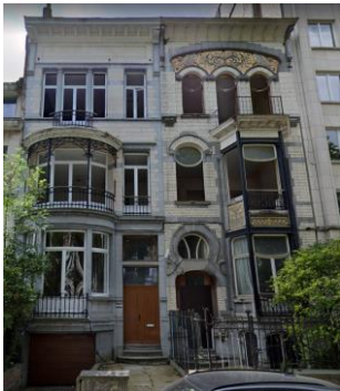
Winston Churchilllaan 29-31

Kortstondige kunst die de Eerste Wereldoorlog niet overleeft.