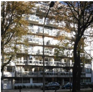
Winston Churchilllaan 194

Het wordt gekenmerkt door gevels in "ruw beton" zonder bekleding, waarvan de oppervlakken vaak de textuur van het bekistingshout vertonen. Het onbehandeld beton behoudt de groeven, de vlammen en de verbindingslijnen van de houten planken die gediend hebben voor het gietstel. De stijl duikt in 1960 op in België en ontwikkelt zich in de jaren '60 en '70, gelijktijdig met het functionalisme, ook afgeleid van het modernisme.