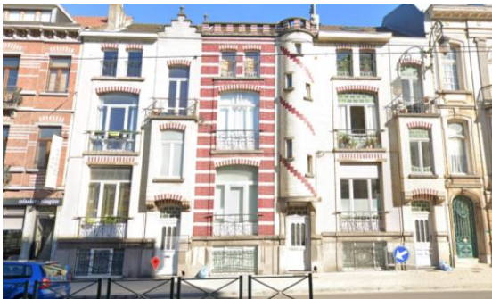
Brugmannlaan 601, 603

Wijst op een vrij gangbaar geveltype in België tussen 1890 en 1914, met een asymmetrische compositie, gekenmerkt door een speelse verwerking van kleurrijke materialen en tal van ornamenten.