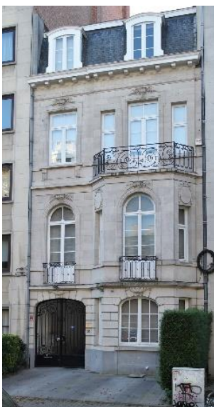
Winston Churchilllaan 121

Late vorm van neoclassicisme gekleurd met eclecticisme die verschijnt tussen ongeveer 1905 en 1930. Rijkversierde architectuurstroming die haar inspiratie haalt uit de grote Franse stijlen van de 18e eeuw.