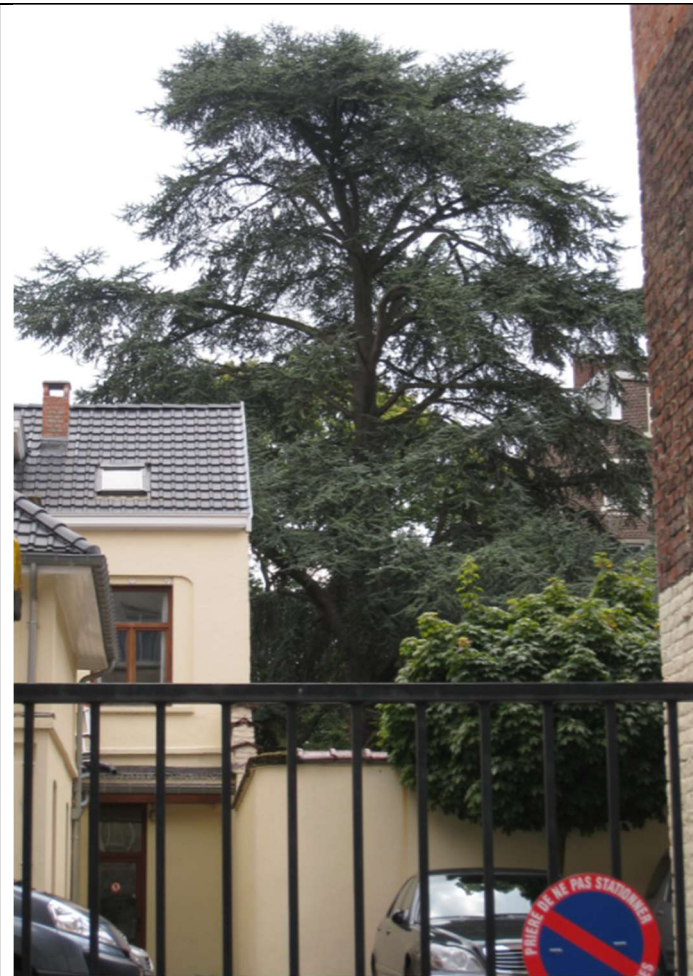
Avenue Winston Churchill 214

Cèdre bleu de l'Atlas Cedrus atlantica Gauca