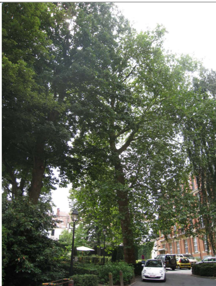
Avenue Winston Churchill 253B