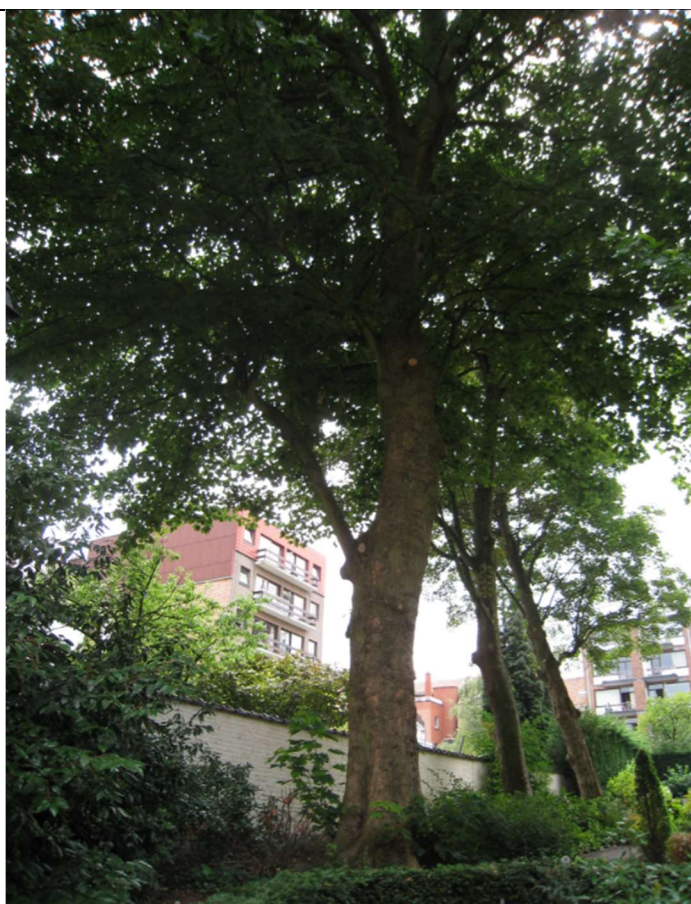
Avenue Winston Churchill 253B

Coordonnées Lambert : X : 149936 / Y : 166765