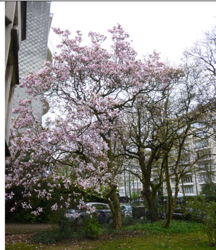
Avenue Winston Churchill 228

Coordonnées Lambert X : 149604 / Y : 166838